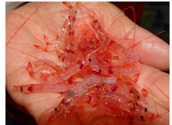
図 水揚げ直後の桜エビ