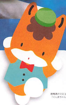
群馬県のマスコット 「くんまちゃん」