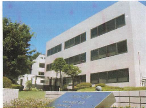
当社社屋(アクア 21 ビル)