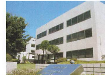
当社社屋(アクア 21 ビル)