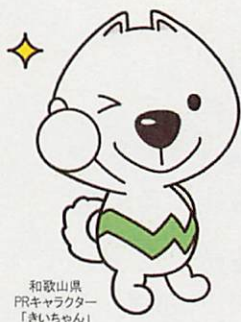
和歌山県 PRキャラクター 「きいちゃん」