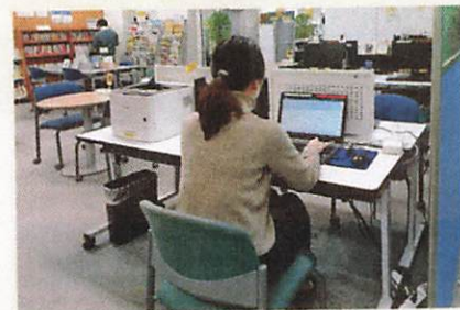
書類作成コーナー