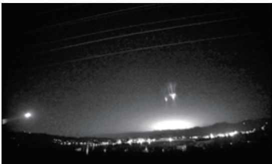
Fig. 1c Event 3 (22:57:02, December 7, 2016)