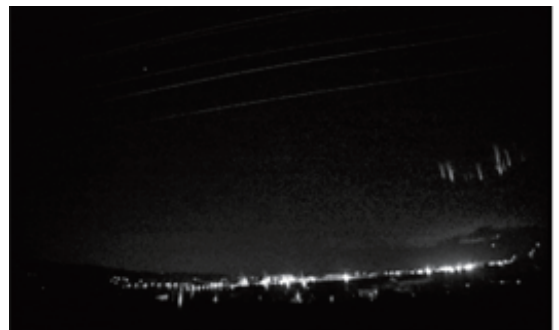
Fig. 1h Event 8 (03:05:11, December 8, 2016)