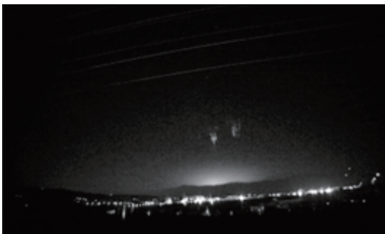
Fig. 1g Event 7 (00:50:51, December 8, 2016)