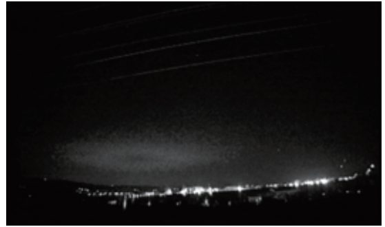
Fig. 1f Event 6 (00:27:37, December 8, 2016)