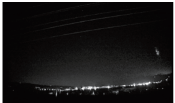
Fig. 1d Event 4 (23:41:57, December 7, 2016)