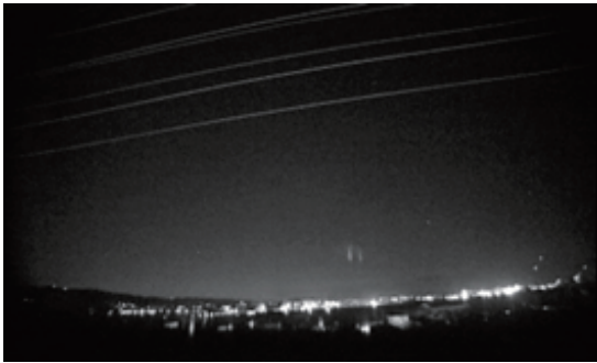
Fig. 1a Event 1 (20:14:31, December 7, 2016)

2016-2017 年の冬は 2016 年 12 月 7 日夜から 8 日朝にかけて多くの冬季雷が発生し、8 件の TLEs を観測した。TLEs は形状の違いによって分類されている (Figs. 1a-1h)。Figs. 1a, 1b, 1h はカラム型スプライトと呼ばれる棒状の発光現象、Figs. 1c, 1d, 1g はキャロット型スプライトと呼ばれる発光現象、Figs. 1e, 1f はエルプスと呼ばれる円盤状の発光現象