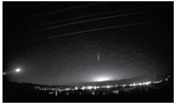
Fig. 1b Event 2 (22:53:23, December 7, 2016)