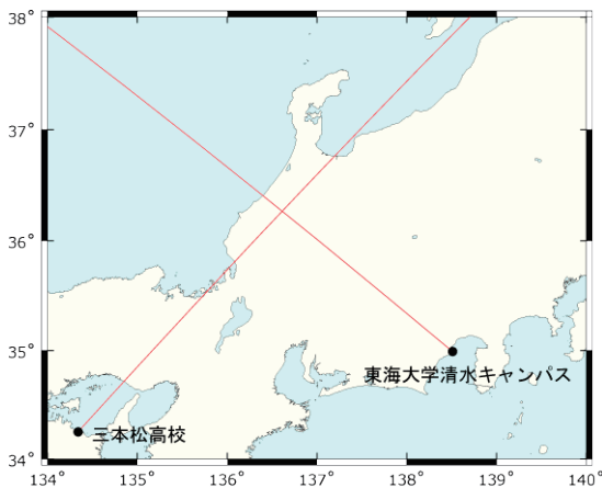
Fig. 2a Sprite location for event 2