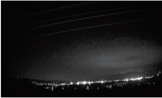
Fig. 1e Event 5 (00:01:25, December 8, 2016)

のカラムないしはキャロットは複数発生しているため発生領域の左右を同定した。この解析から発生地点・領域は、能登半島周辺で発生していることがわかる (Figs. 2a, 2b, and 2c)。